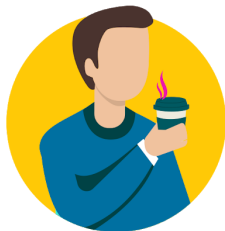
pérdida del sentido del gusto o del olfato