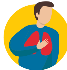
dificultad para respirar