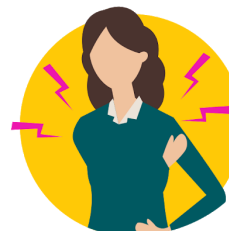
dolor de cuerpo