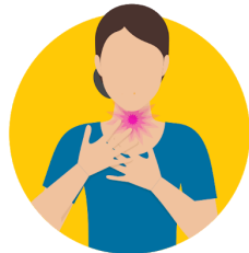
dolor de garganta